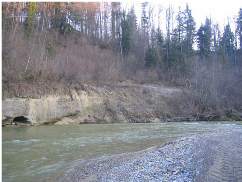
Foto Nr. 3: Rechtsufriger Prallhang km 21.1 - km 21.2 (links feste Nagelfluh, rechts mergelige, erosions- und rutschanfällige Schichten)