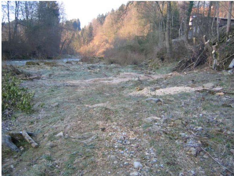
Foto Nr. 11: Bereich für rückwärtige Mulden und Tümpel / Felstümpel (km 21.2 - km 21.4 linksufrig)