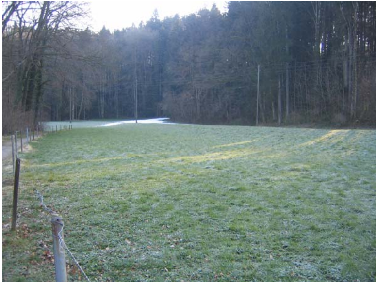
Foto Nr. 14: Blick km 21.4 rechtsufrig abwärts: links (nicht mehr sichtbar) der Renaturierungsbereich, Verlauf des Druckleitungstrassees KW Erlenholz von