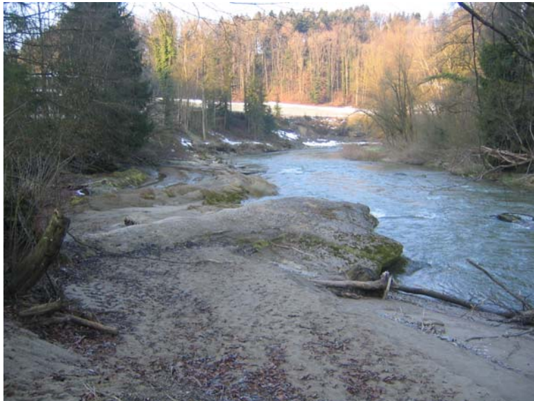
Foto Nr. 2: Schöner, felsiger Ufer- / Vorlandbereich mit Felstümpeln (km 21.0 linksufrig)