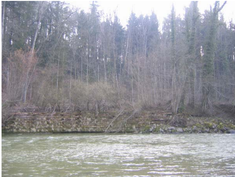
Foto Nr. 4: Holzkastenverbau rechstufmig unterhalb Mündung Oberwilenbach nicht weiter unterhalten, zerfallen lassen