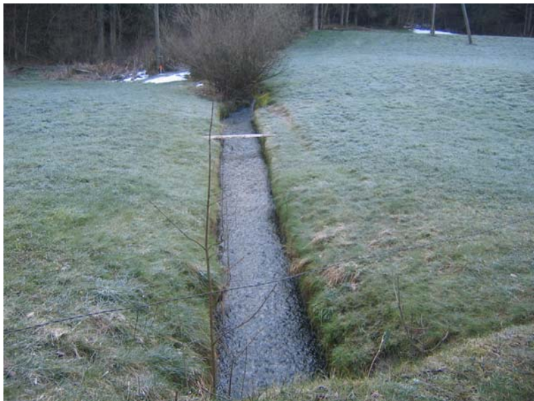
Foto Nr. 12: Mündung Oberwilenbach: Betongerinne abbrechen Umleitung als natürlicher Bachlauf nach rechts (im Bild links)