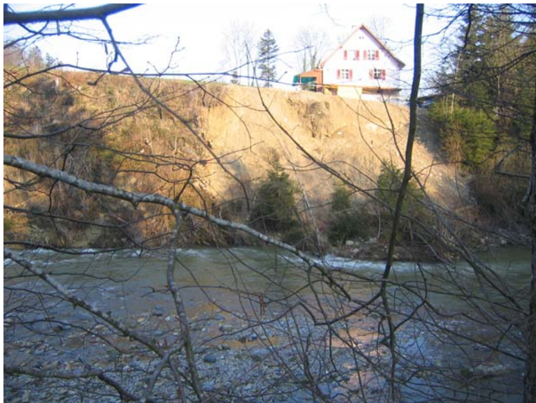
Foto Nr. 15: Anrissböschung bei km 21.4 linksufrig: Sicherung erforderlich, möglichst naturnah ausführen. z.B. Raubbäume / Bepflanzungsmassnahmen (nicht