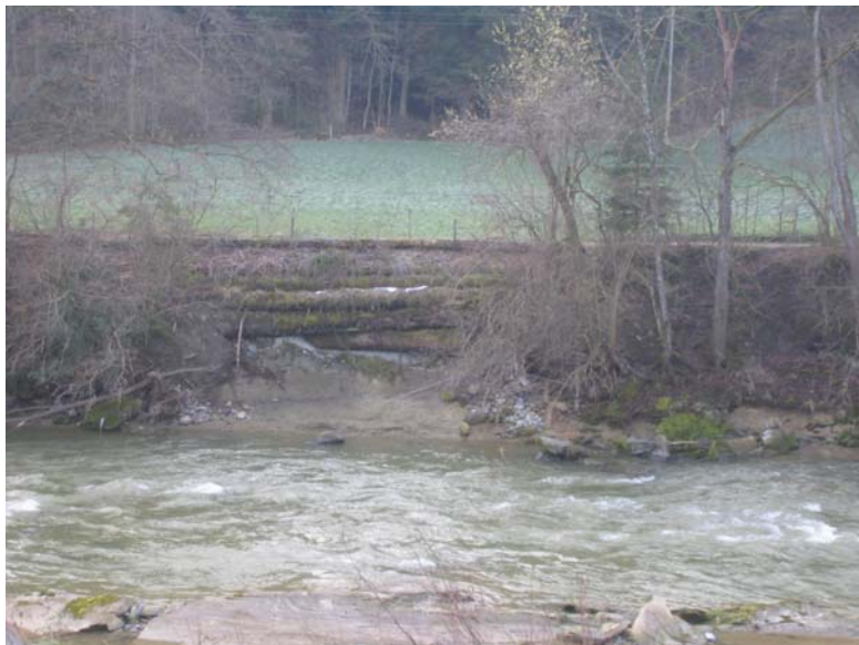
Foto Nr. 6: Bestehenden Rundholzverbau oberhalb Mündung Oberwilenbach: zerfallen lassen, evtl. mittel-langfristig Weg vom Ufer weg verschieben