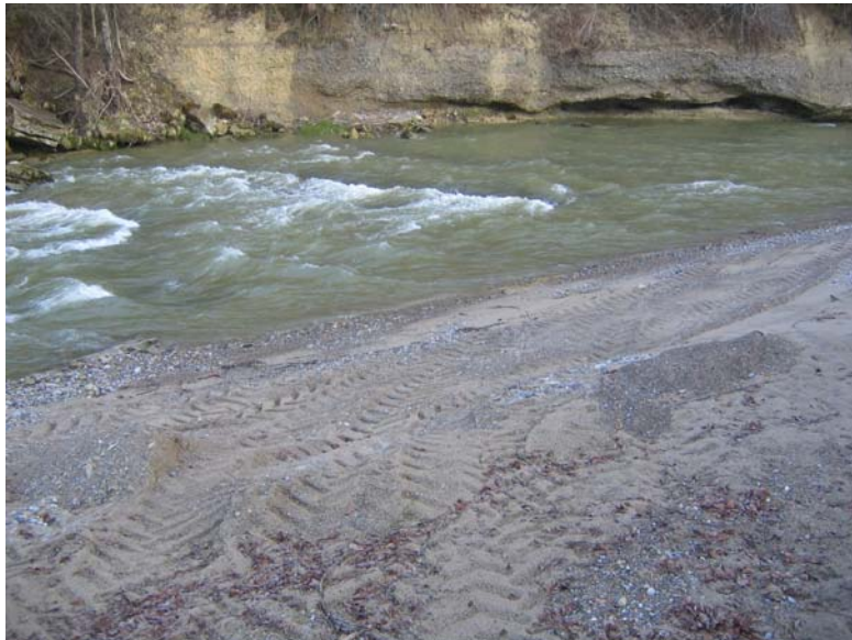
Foto Nr. 8: Frische Fahrspuren von widerrechtlichen privaten Kiesentnahmen aus der Sitter (km 21.175)