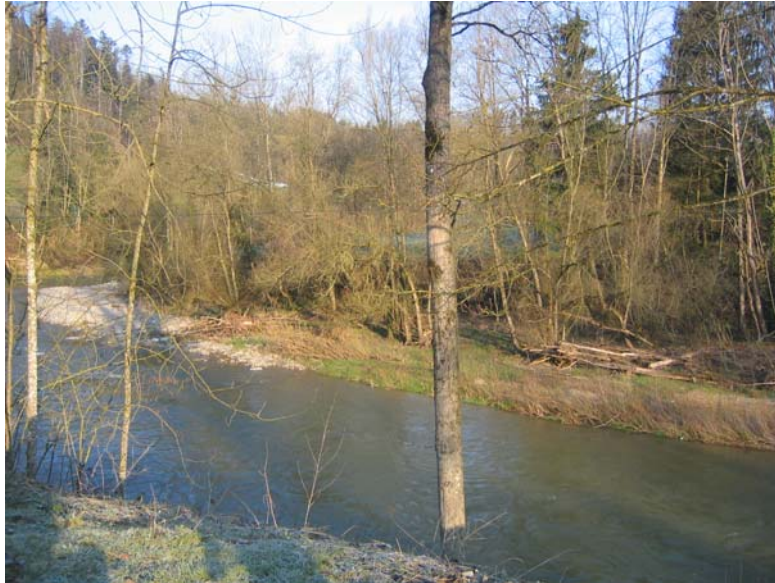
Foto Nr. 1: Schöne Flussaue rechtsufrig unterhalb Sitterschlaufe Erlenholz