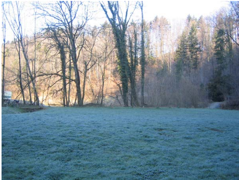
Foto Nr. 13: Wiese in Waldecke nördlich der heutigen Mündung des Oberwilenbaches: Neuführung natürlicher Bachlauf, Anlage von wechselfeuchten