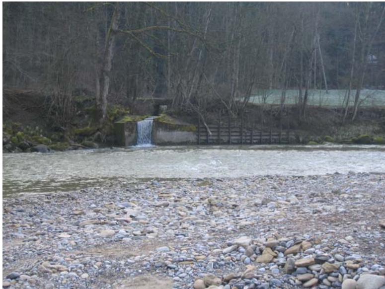
Foto Nr. 5: Mündung Oberwilenbach: Abbruch Verbauungen und Mündungsbauwerk