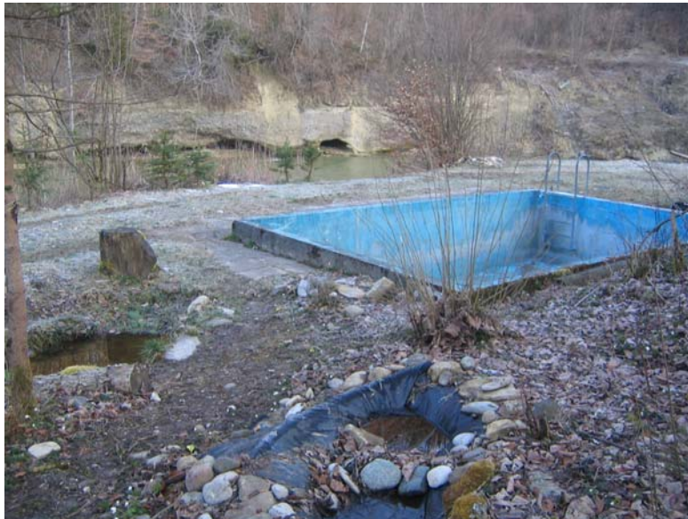
Foto Nr. 7: Betonbassin und Folientümpel abbrechen, Mulden belassen (wechselfeucht)