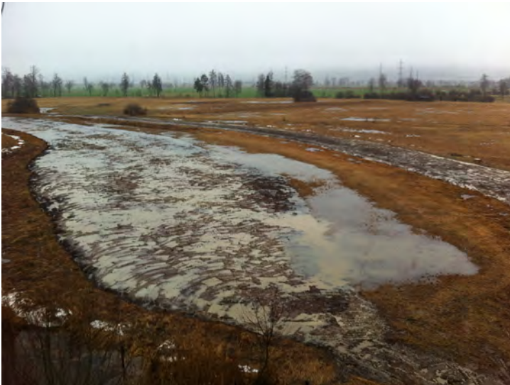
03.02.2016: Beide Teilflächen sind fertig abgeschürft