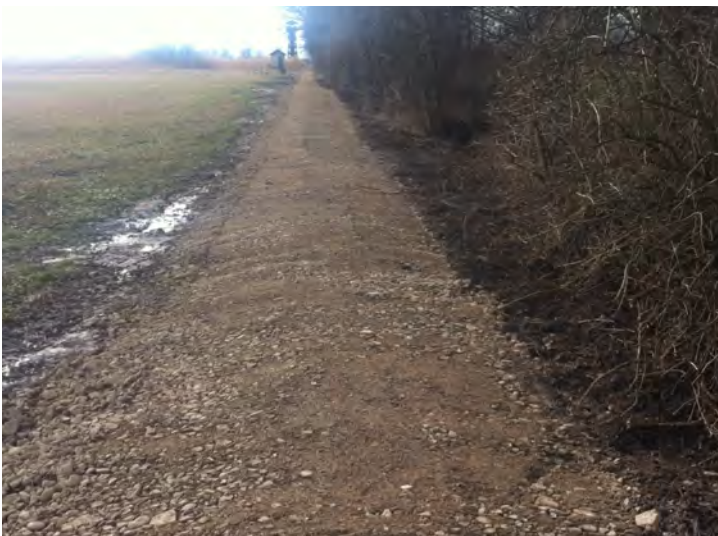
18.02.2016: Der Zufahrtsweg wurde neu eingekiest und wieder hergestellt