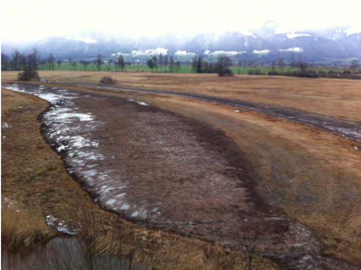
10.02.2016: Bei einem Wasserstand von 40cm (Messlatte Weg) sind die Schürfflächen noch nicht überflutet