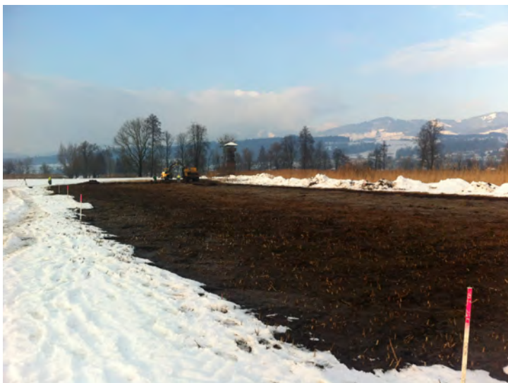
21.01.2016: Ein grosser Teil der östlichen Teilfläche ist bereits abgeschürft.