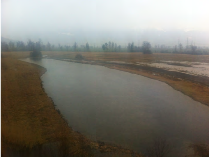
15.03.2016: Bei einem Wasserstand von 66cm (Messlatte Weg) ist die östliche Teilfläche überflutet, die westliche Teilfläche noch nicht