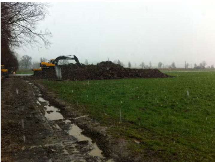
03.02.2016: Das Zwischenlager nach Abschluss der Abschürfungen