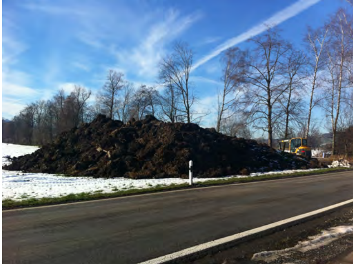
26.01.2016: Das Zwischenlager an der Benknerstrasse