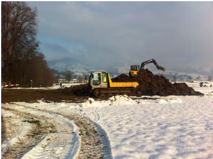
21.01.2016: Zwischenlager des Aushubs an der Benknerstrasse