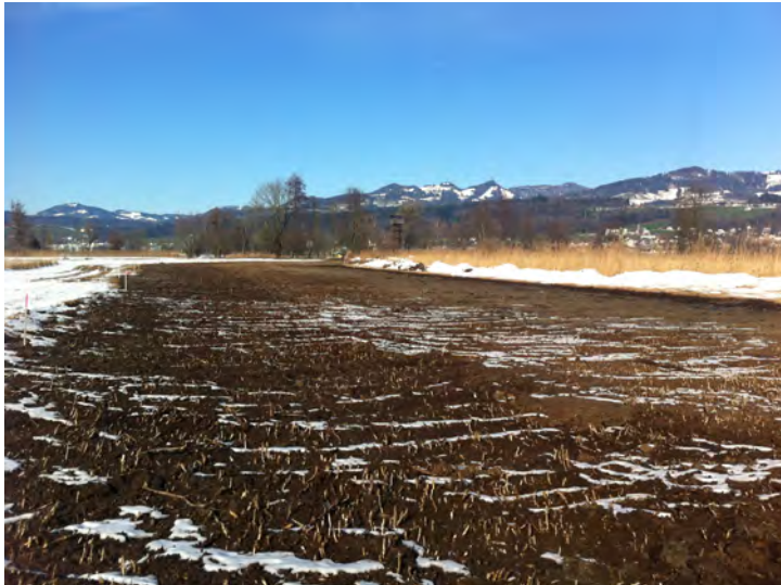
26.01.2016: Die östliche Teilfläche ist fertig abgeschürft