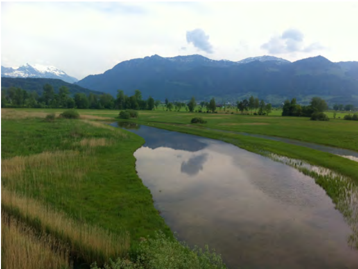
18.05.2016: Bei einem Wasserstand >70 cm (Messlatte Weg) sind beide Teilflächen überflutet.