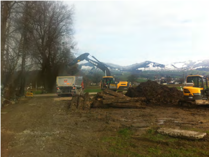
18.02.2016: An fünf Tagen wurde bei geeigneter Witterung das Aushubmaterial abtransportiert