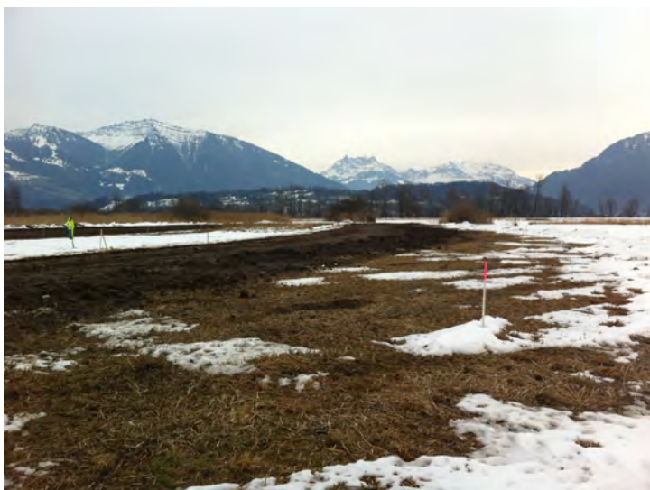
28.01.2016: Die westliche Teilfläche ist zur Hälfte abgeschürft