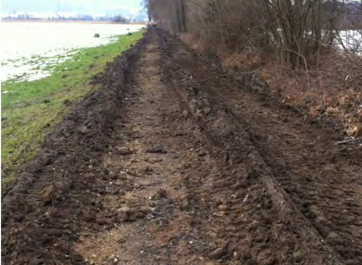
28.01.2016: Der Zufahrtsweg zum Projektperimeter wird stark beansprucht durch den Materialtransport