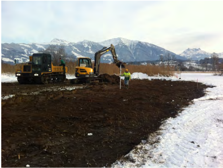
18.01.2016: Beginn Abschürfarbeiten östliche Teilfläche